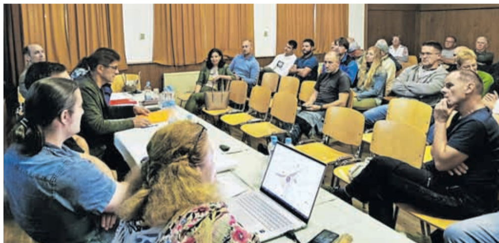
Krajanom Žabnice so predstavili tudi načrtovano ureditev križišča pri Podružnični šoli Žabnica.

ta so podrobneje predstavili projekt, ministrstvo za infrastrukturo bo njegovo izvedbo začelo v prihodnjem letu. Predhodno je treba še odkupiti zemljišča. Namen ureditve je, da bi lokalnim prebivalcem zagotovili večjo varnost v prometu, hkrati bi uredili tudi obe avtobusni postaji. Eno je Mestna občina Kranj v preteklem letu že sprojevala v okviru projekta ELENA, avtobusno postajo nasproti šole pa končuje