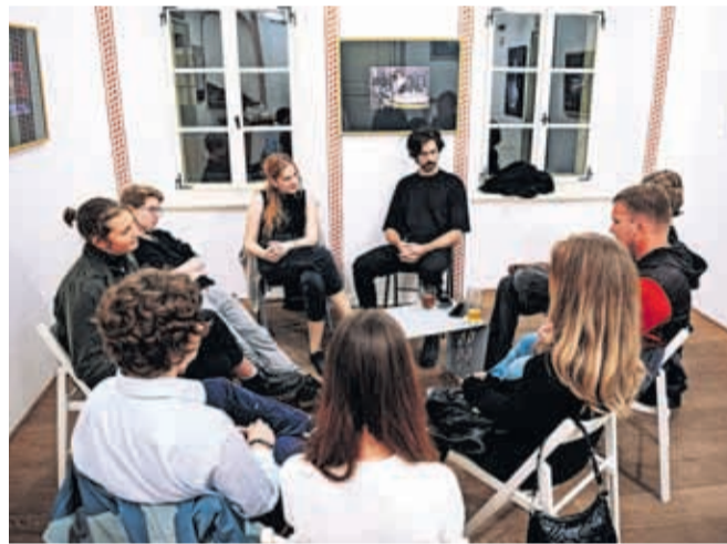
Mladi pesniki na delavnici slam poezije SOS slam

kar pomeni, da je bilo predstavljenih tudi nekaj pesnikovih »pred kratkim nastalih in še neobjavljenih pesmi«.