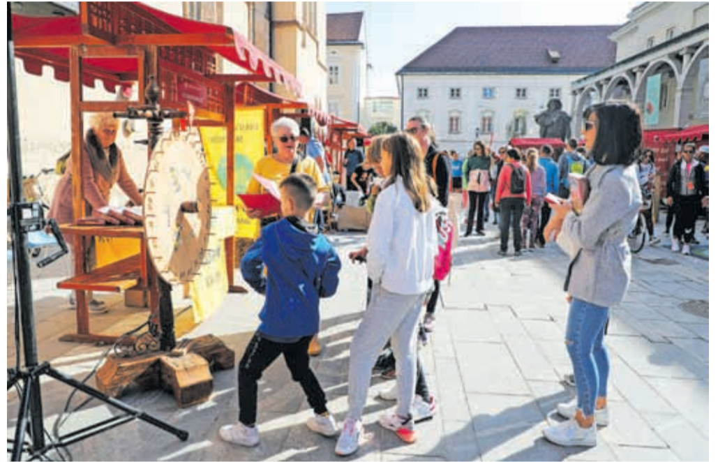
Predstavitve krajevnih skupnosti, na fotografiji stojnica KS Zlato polje

Kranj – Drugo oktobrsko soboto se je na prvem Dnevu krajevnih skupnosti, ki je potekal na trgu pred Prešernovim gledališčem, predstavila polovica od 26 krajevnih skupnosti v Mestni občini Kranj (MOK): Besnica, Bitnje, Britof, Golnik, Hrastje, Kokrica, Planina, Podblica, Primskovo, Stražišče, Stružev, Zlato polje in Žabnica. Krajevne skupnosti so se na srečanju, ki bo postalo tradicionalno, predstavile s kulinariko, izdelki, kulturno dediščino svojega okolja, kulturnim programom ... Dogodek, ki je potekal v sproščenem vzdušju, so popestrili z delavnicami za najmlajše, družabnimi igrami in nastopi Kulturno-umetniškega društva Mali vrh Nemilje - Podblica ter Akademске folklorne skupi-