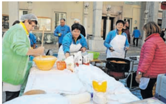
KS Kokrica je poskrbela, da je dišalo po sveže ocvrtih flancatih.

ne Ozara. Kot so poudarili na MOK, je bilo srečanje tudi odlična podlaga za iz-