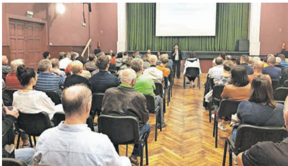
Na srečanju s kraji KS Primskovo so se pogovarjali predvsem o možnosti ureditve enosmernih povezav na njihovih ulicah.

Že več kot desetletje je želja krajanov Žabnice, da se končno uredi križišče pri Podružnični šoli Žabnica. V uresničitev tega predloga je bilo v preteklih štirih letih vloženega veliko navora tako uprave kot tudi sveta krajevne skupnosti. Predstavniki države, občine in projektan-