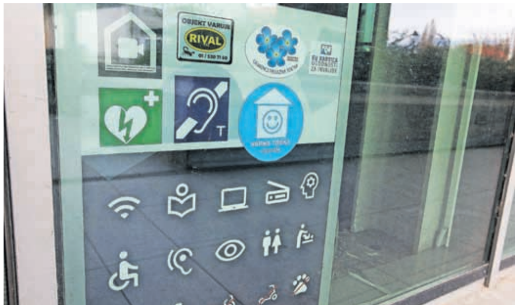
Varne točke prepoznamo po modri nalepki z belo smejočo se hišico, ki je nalepljena na vhodu v javni prostor.

V varni točki se otroku oziroma mladostniku zagotovi varen prostor, omogoči se mu pogovor in se mu prisluhne, se ustrezno reagira. Vsi zaposleni gredo namreč skozi usposabljanje, ki ga organizira Unicef Slovenije, kjer se pripravijo na to, kako reagirati ob prihodu otroka in mladostnika, kako z njim komunicirati ter na katero pristojno institucijo se je treba obrniti, kadar je potrebna strokovna pomoč. V mestni občini Kranj je trenutno sedemnajst varnih točk, kamor se otroci in