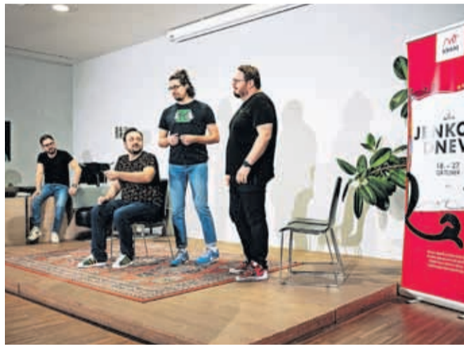
Klub nesmrtnih pesnikov z odličnimi improvizatorji KUD Kiks / FOTO: PRIMOŽ PIČULIN