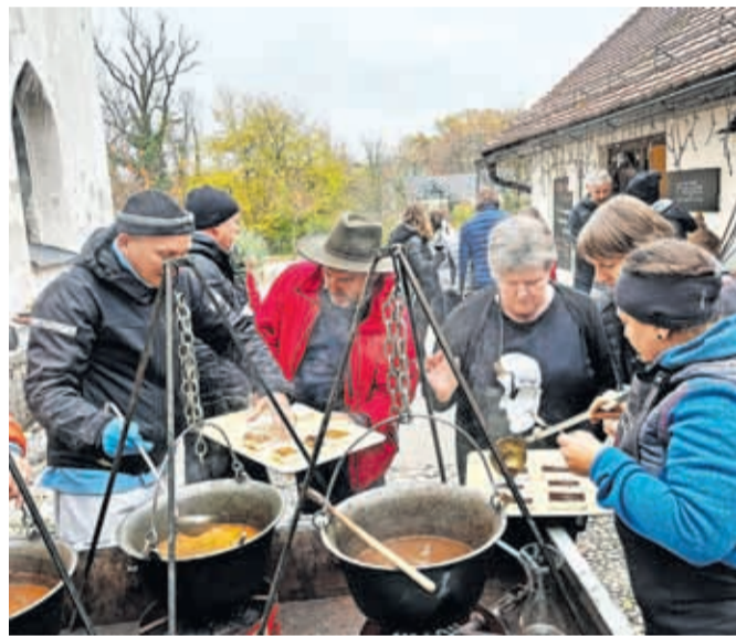
Skuhane golaže bodo razdelili. / FOTO: ARHIV CAFÉ GALERIJE PUNGERT

Café galerija Pungert je znana tudi po pestrem martinovem dogajanju in tako bo tudi letos. V soboto, 11. novembra, se boste lahko ves dan okrepčali s klobasami, joto in Jordanovim novim likerjem. Teden kasneje, 18. novembra, pa sledi legendarno tekmovalstvo v kuhanju golaža. Tri dvočlanske ekipe se bodo pomerile v tem, kdo skuha najboljši golaž iz pov-