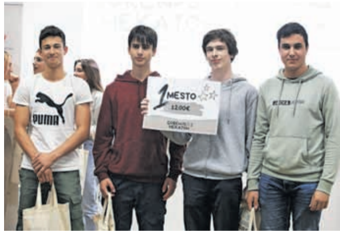
Zmagovalci Loški mnogoceličarji