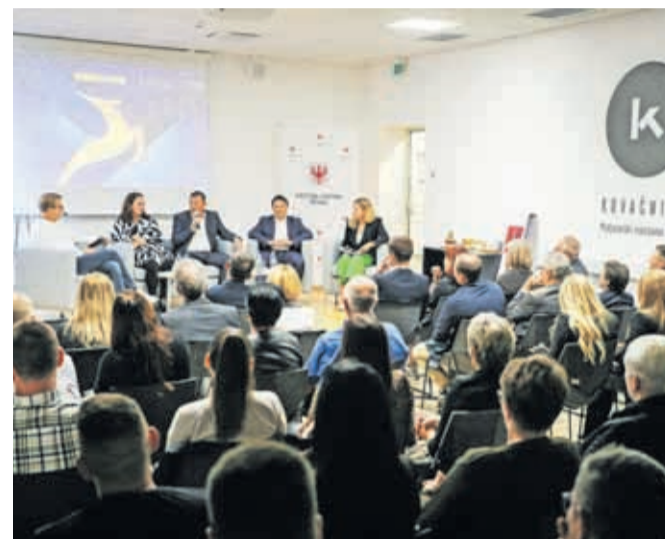
Pogovor s tremi nominiranci v kranjski Kovačnici