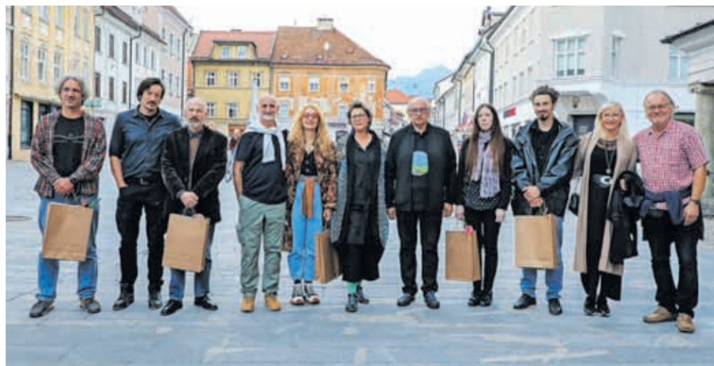
Mednarodni festival likovnih umetnosti Kranj – ZDSLU