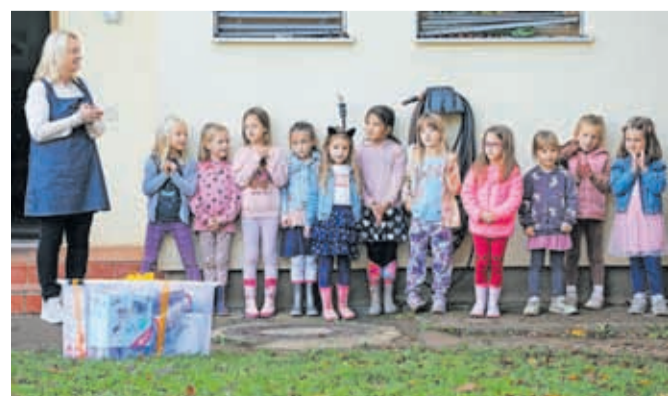
V vrtcih Čenča (na sliki) in Biba so jubileja zaznamovali s kratkima slovesnostma.