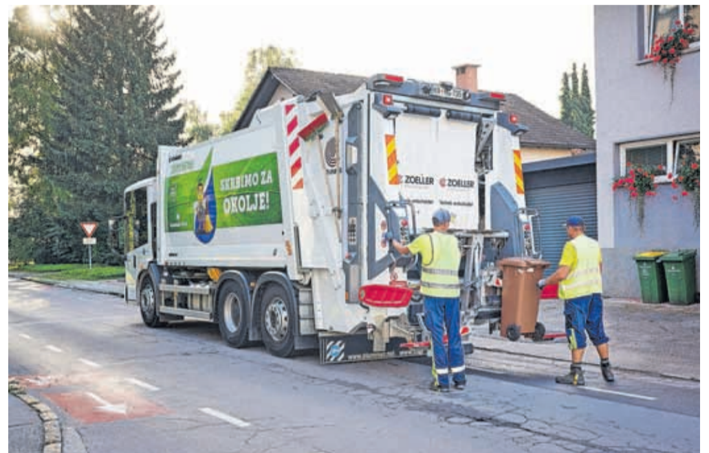
Povprečen uporabnik v Kranju zavrže slabih sto kilogramov bioloških odpadkov na leto.

Na področju ločenega zbiranja na izvoru so lokalne skupnosti in komunalna podjetja dosegli zavidljivo raven, po drugi strani pa država ni poskrbela za nadaljnjo predelavo, saj se samo 15 odstotkov ločeno zbranih odpadkov predela v Sloveniji. Tako