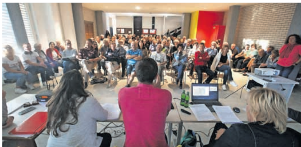
Krajanom KS Vodovodni stolp so predstavili načrtovane spremembe prostorske ureditve na njihovem območju.